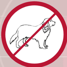
Tiere / animals / animaux