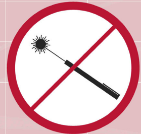
Laserpointer / laserpointer / pointeur laser