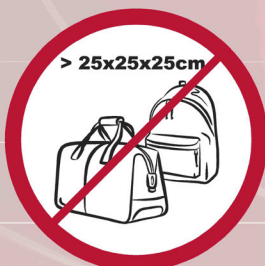
Sperrige Gegenstände, (z.B. Taschen, Rucksack) usw > 25x25x25 cm / eg. unwidely items, large bags, etc. > 25x25x25 cm / ex: valises, sacs et objets qui dépassent 25x25x25 cm