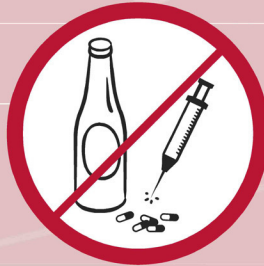
Alkoholische Getränke, Drogen / alcohol drinks, drugs / boissons alcooliques, drogues