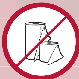
Papierrollen / paper rolls / rouleaux de papier