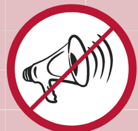
Mechanische oder elektronische Lärminstrumente / mechanical or electrical devices such as megaphones / instruments mécaniques produisant du bruit, mégaphones et klaxons