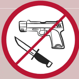
Waffen, gefährliche Gegenstände / firearms, weapons / armes à feu, armes blanches