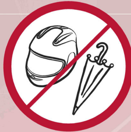
Schirme, Helme / umbrellas, helmets / parapluies, casques