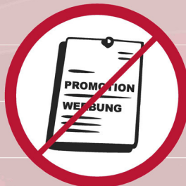
Werbematerial/ -bekleidung / promotional materials and clothing / matériel et habits publicitaires