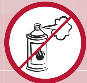
Gassprühdosen / aerosol sprays / sprays au gaz ou inflammables