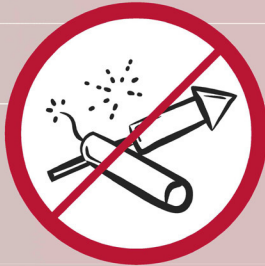
Feuerwerkskörper, Leuchtkugeln, Rauchpulver, pyrotechnische Gegenstände / pyrotechnics / feux d'artifice, poudre de fumée, engins pyrotechniques