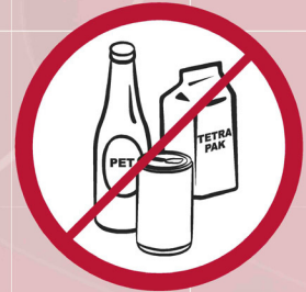
Flaschen, Becher, Dosen etc. / glassware and bottles / bouteilles, tasses, carafes, canettes, etc.